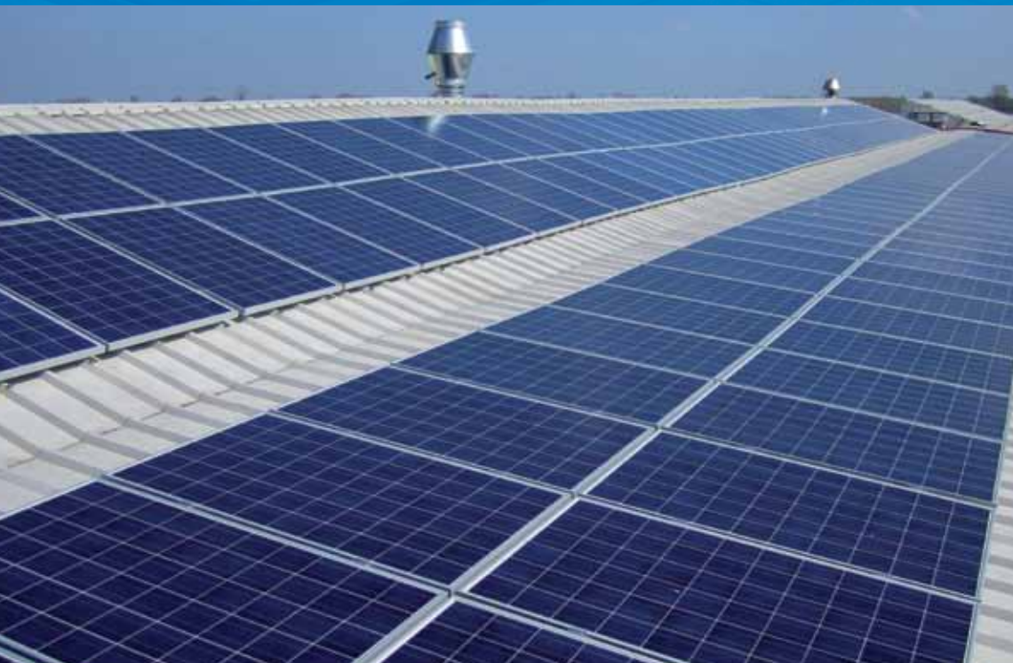
Impianto di nuova costruzione 917 kWp Immergas