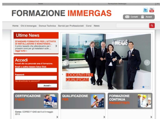
Nelle foto, a sinistra una parte pratica del corso, a destra la home page del sito www.formazioneimmergas.com .